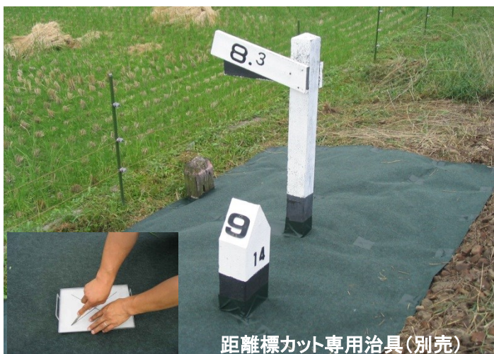
距離標カット専用治具(別売)

デラシートは抜群の貫通抵抗力で“チガヤ”“ヨシ”“ススキ” “セイタカアワダチソウ”の芽と根を完全防御！！